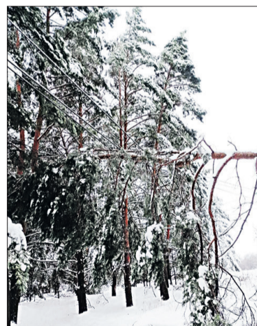
■ Натиск стихии не выдерживали даже большие деревья.

циклона было задействовано 38 бригад энергетиков: 152 специалиста, оснащённых 38 единицами высокопроходимой спецтехники. В первую очередь, энергетики обеспечивали электроэнергией социально значимые объекты и население.