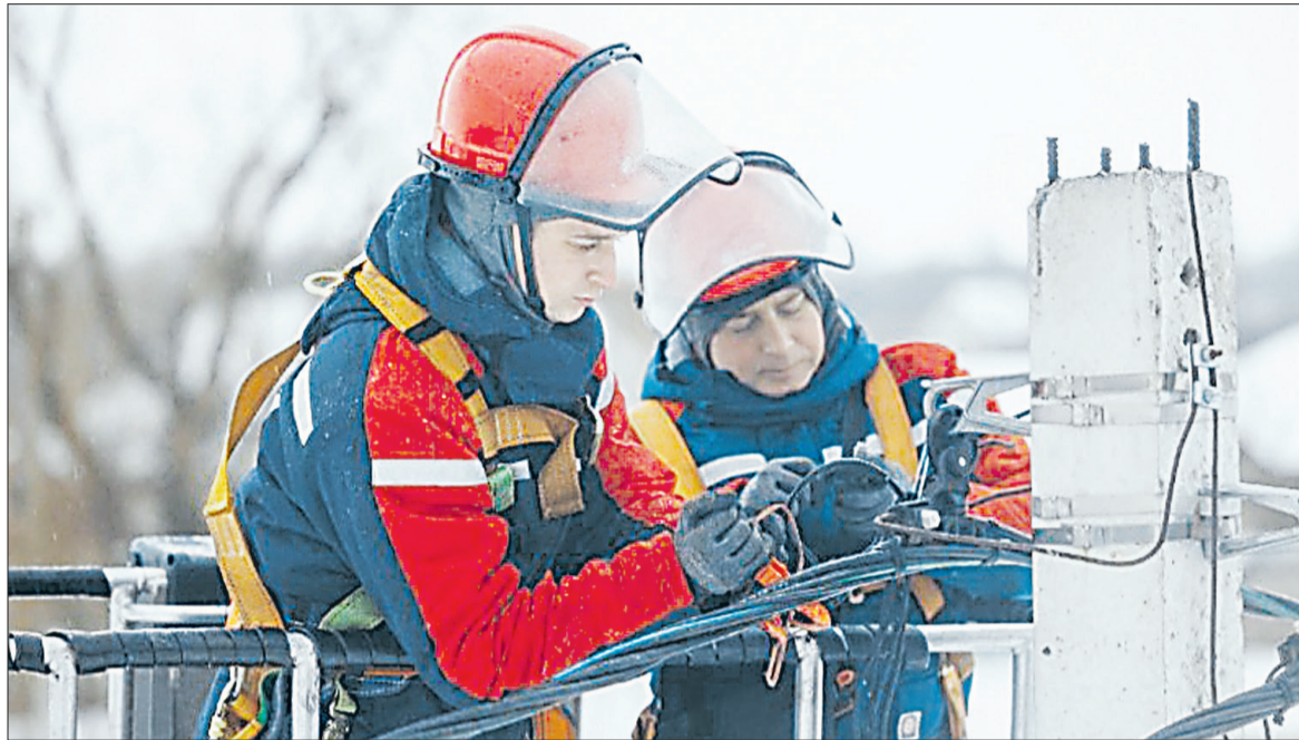
■ Эти бесстрашные люди, энергетики, практически круглосуточно устраняли последствия обледенения.

53-летний водитель на автомобиле «Мерседес» допустил проезд перекрёстка на запрещающий сигнал светофора на 638 км ФАД «Крым». Он совершил столкновение с автомобилем «Пежо» под управлением 41-летней женщины. Водитель автомобиля «Пежо» и её 8-летний пассажир в результате аварии пострадали и были доставлены в медучреждение.