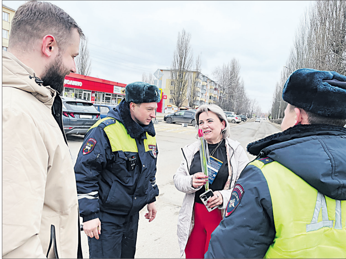
☉ Цветы и сувениры автоледи от сотрудников ГИБДД и общественников.

Экипаж отдельной роты ДПС УМВД Белгородской области заметил автомобиль в кювете, двигаясь по маршруту патрулирования на автодороге «Северный - Строитель». И правоохранители сразу поспешили на помощь. Госавтоинспекторы остановили проезжавший мимо автокран, водитель которого согласился помочь. Пока один из инспекторов координировал вызовление транспорта, другой обеспечивал дорожную безопасность на участке дороги.