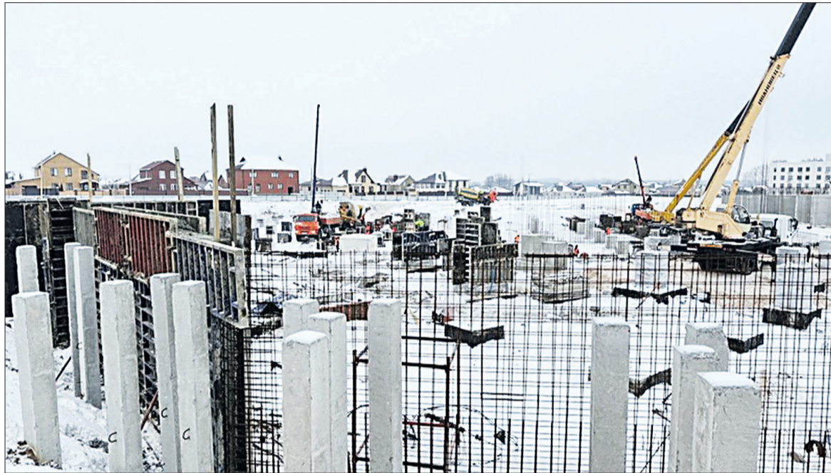
■ Строительство новой школы в Строителе уже вышло из нулевого цикла.