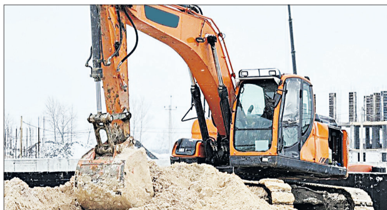
■ Техника на объекте работает без остановок.

этом месяце на площадке приступят к монтажу каркаса здания. В ходе планёрки поставлены задачи по наращиванию темпов работ, рассмотрены проблемные вопросы. Одним из них является содержание участка автомобиль-