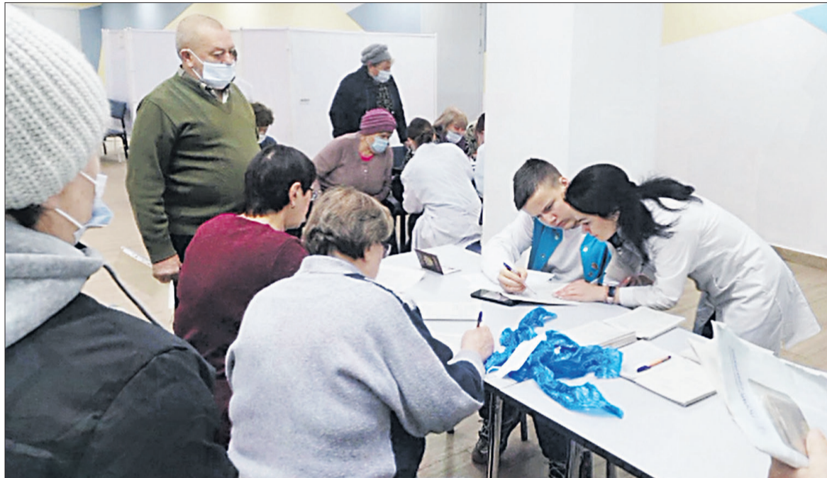
Томаровцы охотно откликнулись на возможность проверить своё сердце.

Также продолжается реализация региональной программы, инициированной в 2021 году Вячеславом Гладковым, по предоставлению жилья врачам, которые решили работать в белгородских медучреждениях.