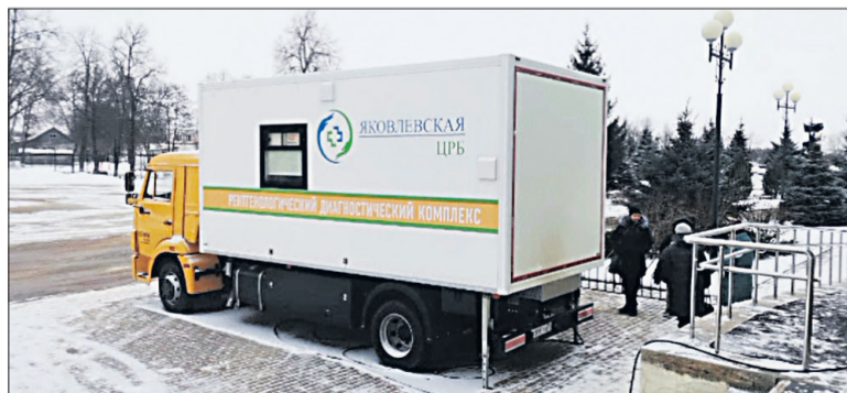
Передвижной медицинский кабинет.

оказывали посильную помощь в регистрации пациентов.