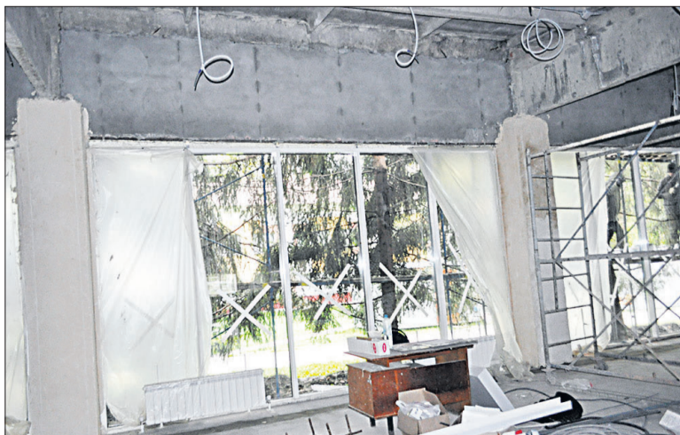
Витражные окна в обеденном зале пищеблока значительно расширили пространство.