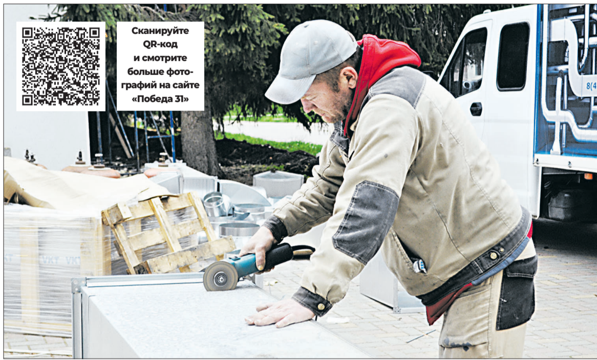
Рабочие подрядной организации готовят к монтажу вентиляционное оборудование.

Смородинский коллектив принял участие в региональном этапе Всероссийского конкурса хоровых коллективов, который проходил в Бехтеевском центре культурного развития. В конкурсе приняли участие детские и взрослые вокально-хоровые коллективы области.