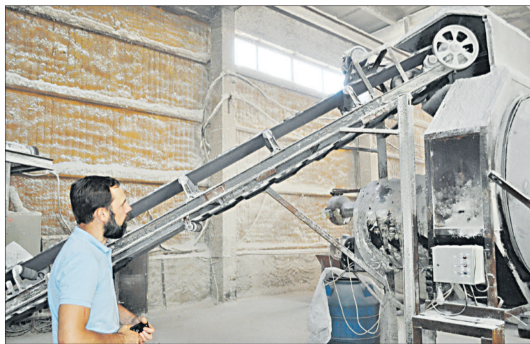
При производстве гранул удобрений используется безопасная для окружающей среды технология.

Белгородский завод минеральных удобрений (БЗМУ), который обосновался на территории Яковлевского городского округа, производит высококачественный гранулированный сульфат аммония и обеспечивает своей продукцией потребности не только местных сельскохозяйственных производителей, соседних областей - Курской, Орловской, Воронеж-