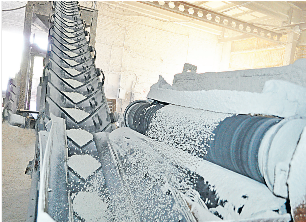
По конвейеру удобрения попадают в полипропиленовые контейнеры.

Подчёркивается, что данное решение будет способствовать росту заработной платы у более чем 4,8 млн россиян. Таким образом соотношение с медианной заработной платой за предыдущий год увеличится до 47,7. Минтруд РФ ранее предлагал увеличить соотношение МРОТ и медианной зарплаты более чем на 14% с 1 января 2025. Антон Котяков, министр труда и социальной защиты РФ, сообщал, что это делается для сохранения опережающих темпов роста МРОТ.