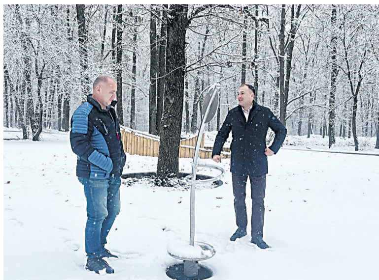
📷 Замгубернатора и глава муниципалитета осмотрели новую детскую площадку в парке.

Проектом предусмотрено обустройство в парке пляжа, водного игрового комплекса, контактного зоопарка, павильона с террасой, большой