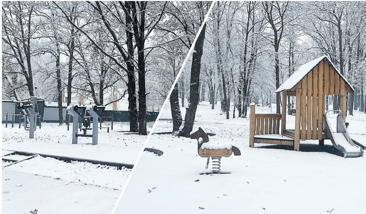
📷 Строители завершили преобразование детской зоны, где расположились спортивная и детская площадки.

Как сообщает пресс-служба МЧС Белгородской области, сообщение о пожаре в жилом доме поступило из села Старая Глинка. На место происшествия выехали дежурные караулы пожарно-спасательных частей № 36 и № 37. Площадь возгорания составила 30 квадратных метров. «К сожалению, в результате происшествия погибла женщина 92 лет. Причина пожара в настоящее время устанавливается», — информирует ведомство.