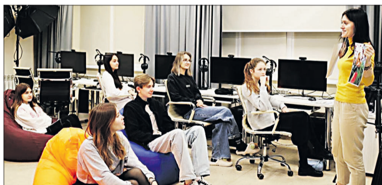
Педагоги школы ненавязчиво и в увлекательной форме будут строить свои занятия.

Обучать в школе планируют более 120 детей в творческих студиях «Дизайн», «Анимация и 3D-графика», «Интерактивные технологии VR/MR/AR», «Фотопроиз-