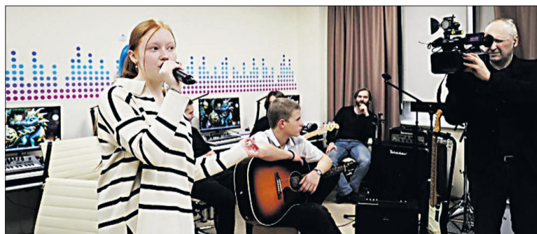
Электронная музыка и вокал – тоже в чек-листе создающейся школы.

водство», «Видеопроизводство», «Электронная музыка» и «Звуко-режиссура и звуковой дизайн». Подобные образовательные учреждения создаются в рамках федерального проекта Минкультуры РФ «Придумано в России».