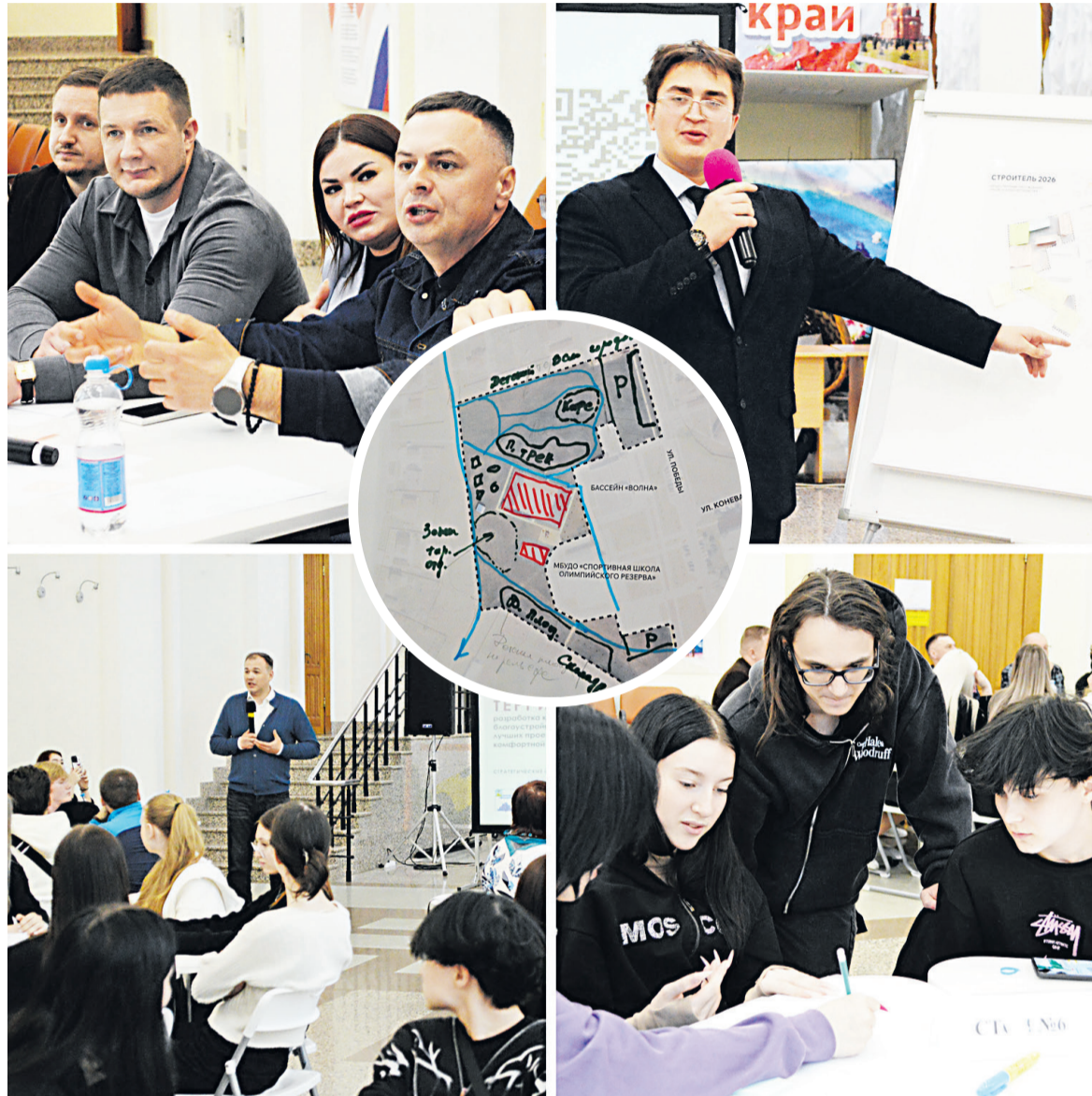
В ходе дебатов и обсуждений участники сессии разработали план проекта парка «Импульс».

Успешное выступление на престижной площадке показало хореографическая группа вокально-хореографического ансамбля «Белогорье» из города Строителя. По итогам фестиваля коллектив пополнил копилку достижений дипломами лауреатов первой и второй степени. Эксперты отметили высокий уровень подготовки белгородских танцоров и их энергетику.