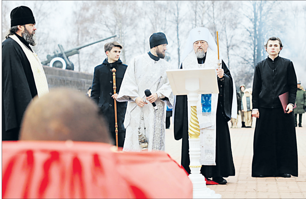
■ Заупокойную литию по героям той страшной войны совершил митрополит Белгородский и Старооскольский Иоанн.

Авария произошла на 4 км автодороги «Томаровка — Стрелецкое — Задельное». 50-летний водитель на автомобиле «Лада Ларгус» совершил наезд на 27-летнего водителя автомобиля «КамАЗ». В результате ДТП 27-летний мужчина и 44-летний пассажир автомобиля «Лада Ларгус» от полученных травм скончались на месте ДТП. Водитель автомобиля «Лада Ларгус» с телесными повреждениями был госпитализирован в медучреждение.