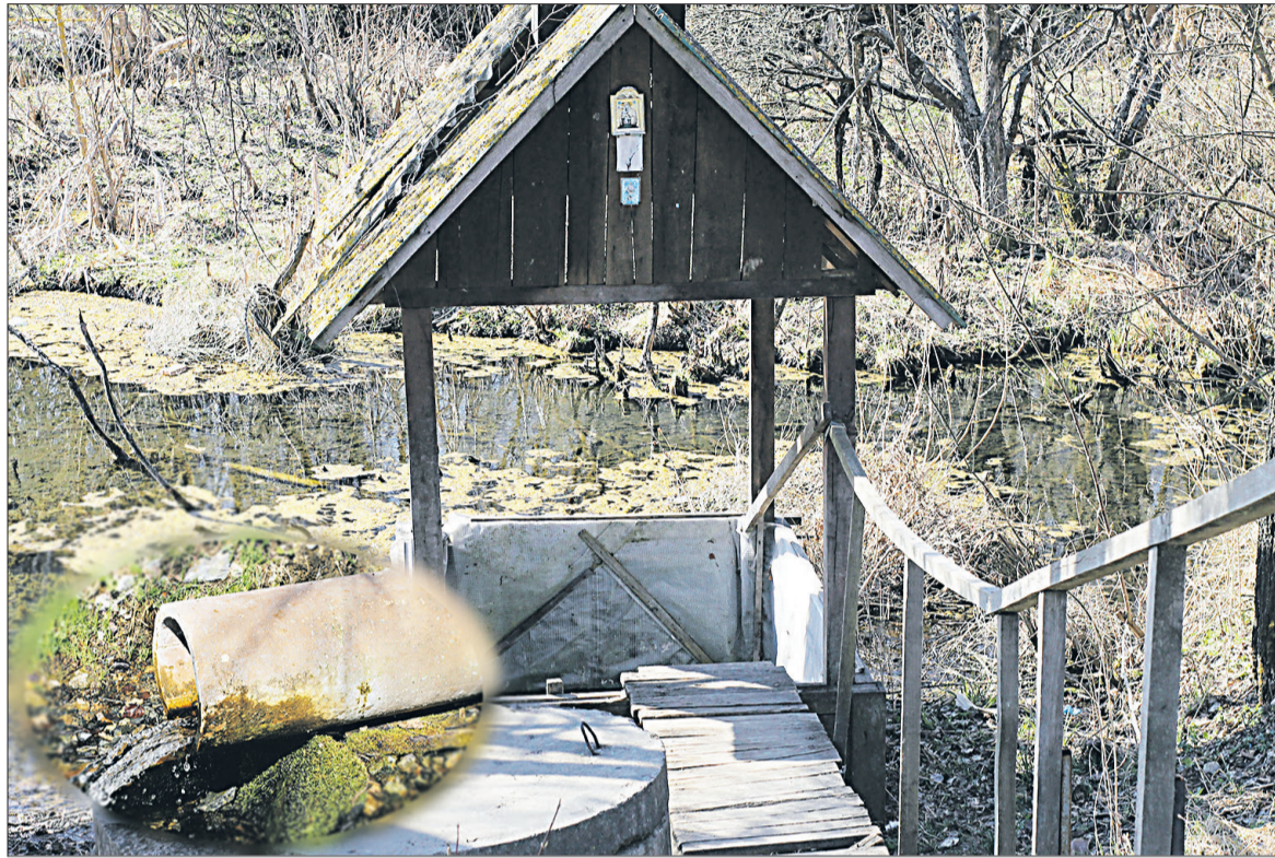
■ Сгнившие доски купели и лестницы, удручающее состояние колец и трубы - сегодня родник на х. Крестов требует незамедлительного обустройства.

Согласно предварительным данным, 39-летняя женщина на «Хендэ Туксон» при повороте налево на регулируемом перекрёстке не уступила дорогу «Дэу Нексии» под управлением 37-летнего мужчины. Он двигался со встречного направления прямо. Пассажир «Дэу Нексии» госпитализирована.