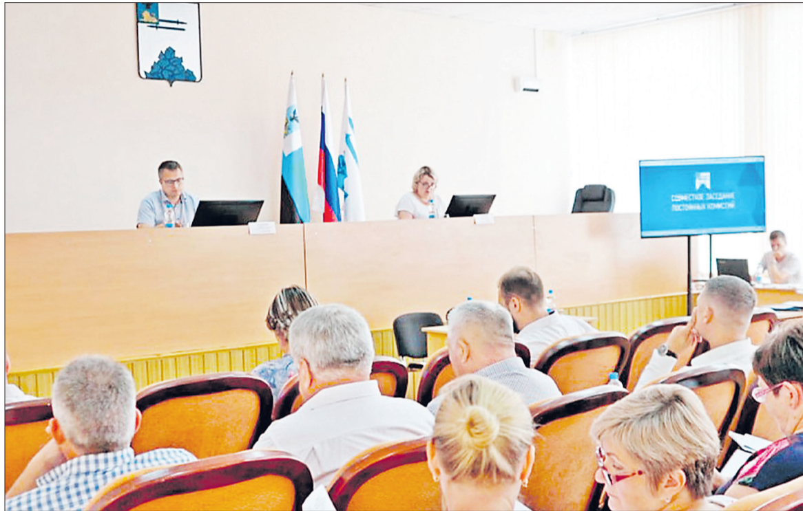
■ Нынешняя команда, отличавшаяся сплочённостью и организованностью, работала пять лет.

Участниками смогут стать юристы, индивидуальные предприниматели, НКО, муниципальные, региональные и федеральные бюджетные учреждения, которые осуществляют деятельность в сфере туризма на территории Белгородской области. Участникам предлагается шесть номинаций: предприятия общественного питания, объекты туристического показа, коллективные средства размещения, не подлежащие обязательной классификации, сельские усадьбы, организации, предлагающие активные виды туризма и предприятия промышленного туризма.