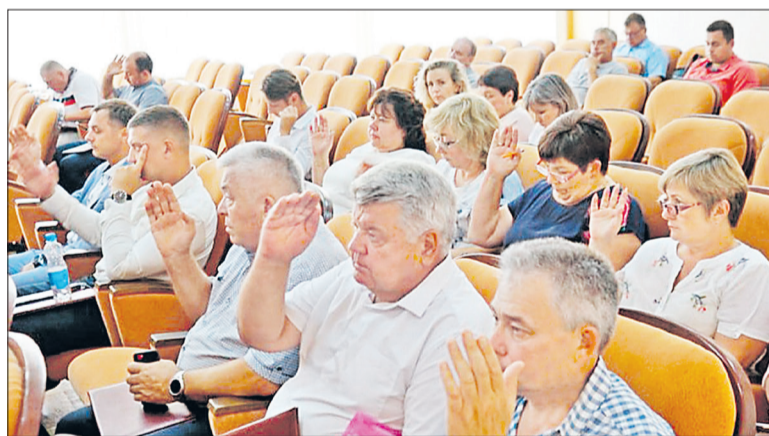
■ Некоторые из нынешних депутатов вновь баллотируются в состав Совета второго созыва.