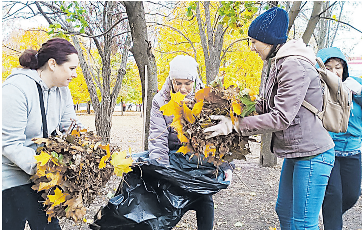
Работники культуры с энтузиазмом и хорошим настроением убирали территорию парка.

Авария произошла 27 октября на автодороге между посёлком Северным и Шопино. На спуске столкнулись «Сузуки», «Лада Гранта» и «Фольцваген Поло». По предварительным данным, девушка-водитель «Сузуки» прибегнула к резкому торможению, в результате которого в неё въехал автомобиль «Лада Гранта», с последующим наездом на «Гранту» автомобиля «Фольцваген».