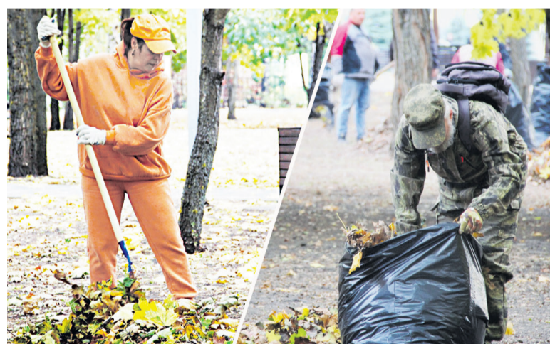
После уборки опавшей листвы в «Сретенском» стало чисто и красиво.

Многие жители города, считают, что убирать листву совсем не стоит. Мол, такая красота, а её – в мусорные мешки и на свалку. Для этой категории граждан популярно объясняем, что есть минимум две причины, из-за которых нужно убирать опавшую листву. Первая – она создаёт благоприятную среду для размножения вредителей и болезнетворных