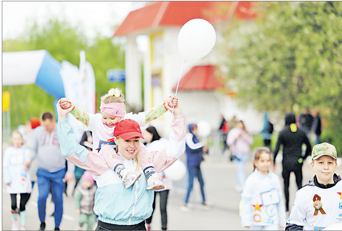
Спортивные семьи - гордость Белгородчины.

Идея о создании лаборатории возникла после поездки делегации школы в Екатеринбург, которая была инициирована губернатором области. В оснащение входят лабораторные комплексы для учебной практической и лабораторной деятельности по химии, каждый из которых насчитывает более 120 наименований.