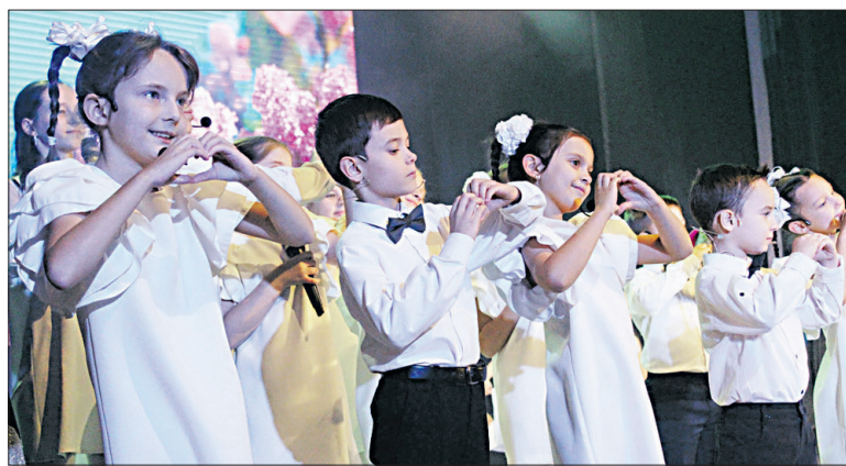
■ Воспитанники эстрадной студии «Ералаш» подарили мамам песню и свои сердечки.

Для каждого человека мама является олицетворением красоты, мудрости, любви. Счастлив тот, кто может признаться в любви к своей маме. Здоровья вам, милые мамы, счастья, благополучия и