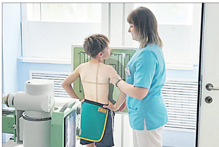
■ С появлением нового оборудования проведение диагностического обследования детей округа проходит на базе детской поликлиники.

- В рамках данного проекта организовано диагностическое обследование детского населения на базе детского поликлинического отделения. Ранее обследование проводилось во взрослой поликлинике. Важно помнить,