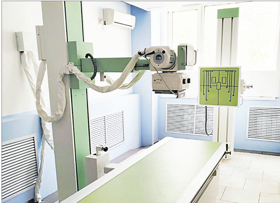
■ Рентгеновский аппарат появился на базе детского поликлинического отделения яковлевской ЦРБ в рамках программы «Модернизация первичного звена сферы здравоохранения».

Специалисты фонда «Защитники Отечества» анализируют текущее состояние жилого помещения и организуют работу по созданию комфортных условий проживания для людей с инвалидностью. Обратиться можно к социальному координатору. Он поможет заполнить все необходимые документы и стать участником программы. Уточнить всю необходимую информацию можно по адресу: г. Белгород, проспект Славы, 28. Или по телефону: +7 (904) 534-42-04.