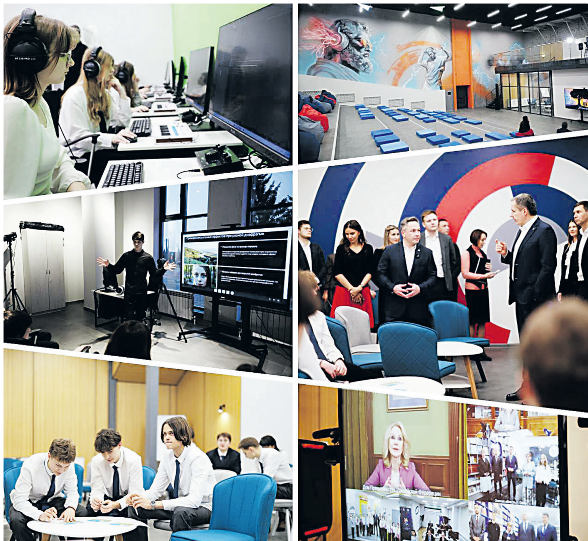
Яковлевская молодёжь будет познавать профессии будущего.

Сотрудники Яковлевского лесничества проводят рейды по хвойным насаждениям. Мера направлена на предотвращение незаконных рубок молодых елей и сосен в предпраздничный период. В ведомстве напомнили об ответственности: гражданам грозит штраф от 3 до 4 тысяч рублей; должностным лицам — от 20 до 40 тысяч рублей; юридическим лицам — от 200 до 300 тысяч рублей. Если ущерб превысит 5 тысяч рублей, нарушителя могут привлечь к уголовной ответственности.