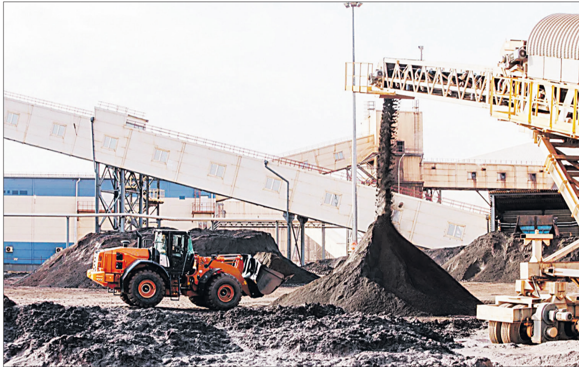
После добычи и дробления руды на ЯГОКе готовая продукция отправляется на Череповецкий металлургический комбинат.