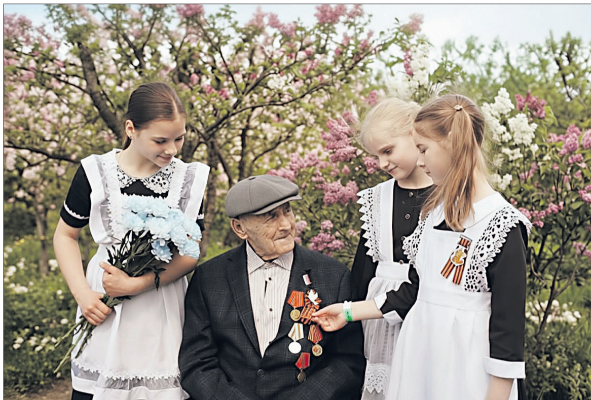
Подрастающее поколение знает и помнит о подвигах тех, кто подарил им мирное будущее.