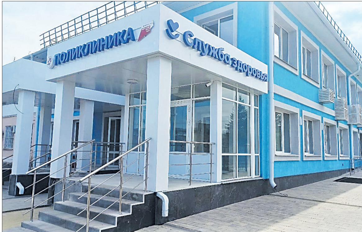
☑ Центральный вход в «Службу здоровья» в п. Томаровке.

Благодаря обновлению многоэтажек свои жилищные условия улучшили почти 32 тыс. белгородцев. На капремонт 229 домов, в числе которых и девять бывших общежитий, направили более 570 млн рублей. Гладков подчеркнул, что введённый механизм общественных приёмов – это залог качественно выполненных работ. Благодаря ему жильцы могут сами оценивать уровень ремонта.