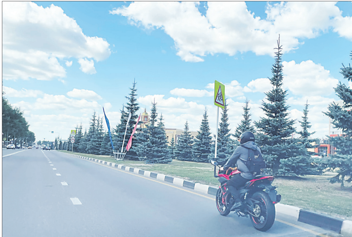
● Всё чаще на улицах Строителя стали мелькать мотоциклисты.

Предварительно было установлено, что 59-летний местный житель утопил в ведре с водой четырёх щенков бездомной собаки. Она стала всеобщей любимцей. При этом мужчина знал, что за его действиями наблюдают как минимум один ребёнок и женщины. Теперь в отношении него возбуждено уголовное дело. Ему грозит от трёх до пяти лет лишения свободы.