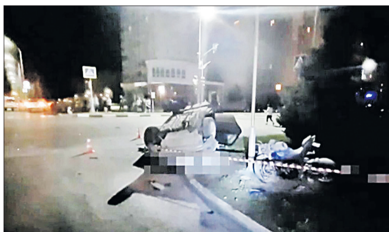
● Ночная авария с гибелью двух человек в г. Строителе.