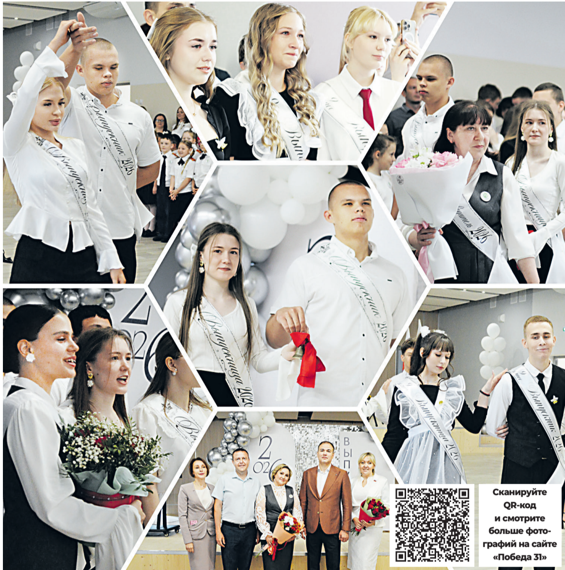
📷 Последний звонок прозвучал для выпускников Кустовской школы, а это значит, что настало время отправляться во взрослую жизнь.

В Яковлевском округе весенняя посевная кампания по сеvu кукурузы вышла на финальную стадию. Аграрии выполнили запланированные объёмы работ в среднем на 80%, сообщил глава администрации муниципалитета Олег Медведев.