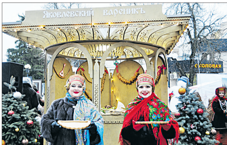
■ Радостными улыбками встречали гостей фестиваля наши милые хозяйюшки.

Яковлевцы удивили всех – они представили, на наш взгляд, самую оригинальную начинку – из квашеной капусты, которую приготовили повара ресторана «Жемчужина». Почему именно такую? Да всё благодаря нашему земляку, великому русскому актёру Михаилу Щепкину, который стал родоначальником «капустников», то есть творче-