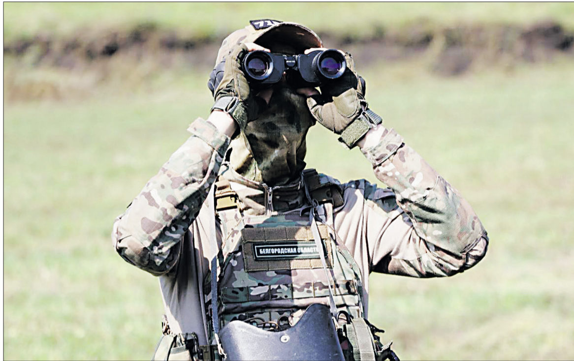
Спецоборудование помогает в решении боевых задач.

Водитель 1959 года рождения на автомобиле ВАЗ-2111 не выбрал безопасную скорость движения. Мужчина не справился с управлением и совершил наезд на дерево. В результате ДТП водитель получил телесные повреждения. Пострадавший был доставлен в районную больницу, где скончался от полученных травм. Обстоятельства аварии устанавливаются, информирует пресс-служба УМВД России по Белгородской области.