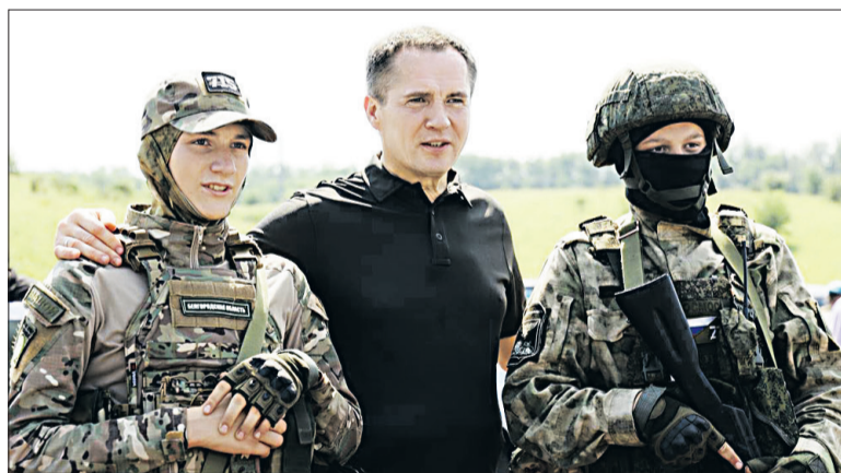
Губернатор Белгородской области Вячеслав Гладков с бойцами теробороны.

На днях губернатор Белгородской области Вячеслав Гладков вручил представителям восьми батальонов теробороны региона автомобили и дополнительное снаряжение. В их числе и сводный оперативный отряд содействия правопорядка «Вымпел» Яковлевского городского округа, которым руководит