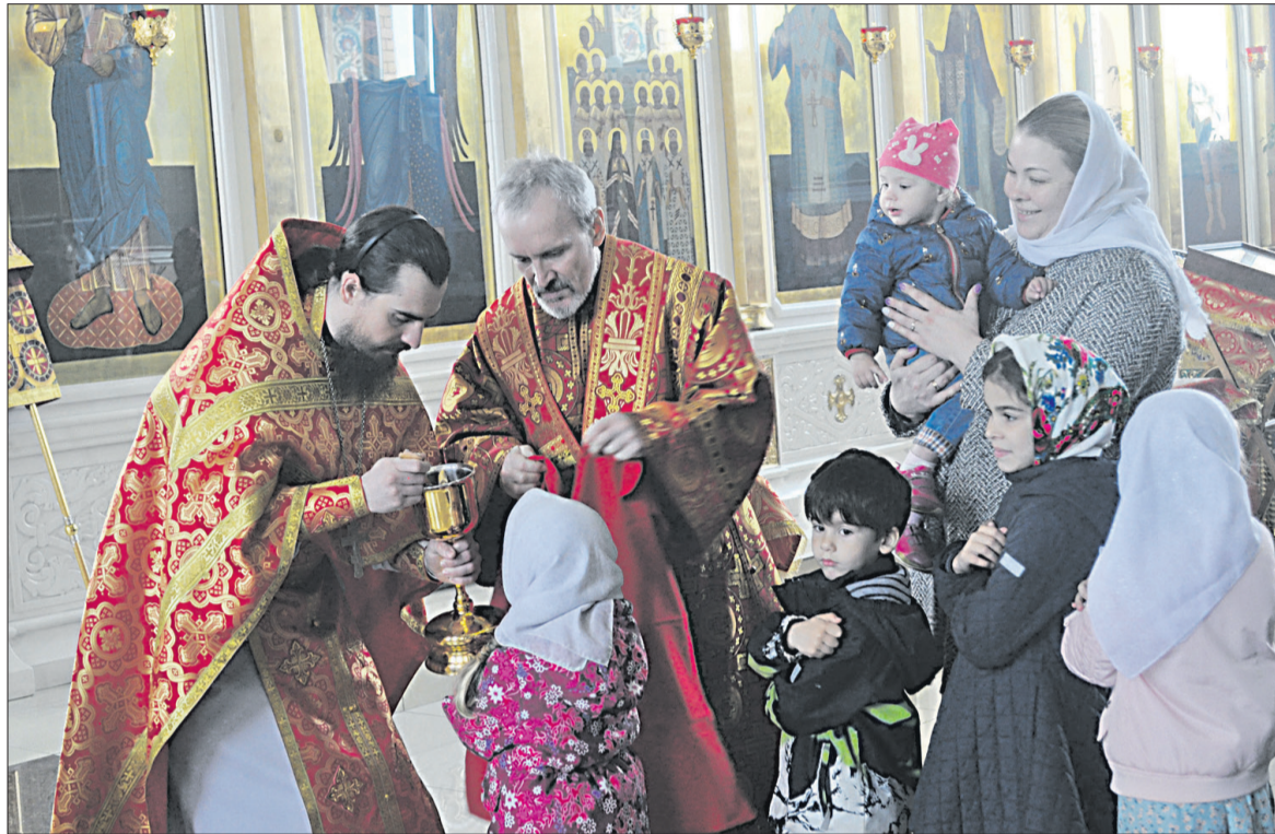
■ В праздник Пасхи каждый желающий после службы мог причаститься.

Отметим, что в период с 15 апреля по 29 октября 2023 года на маршрутах к дачным и садово-огородным участкам в выходные и праздничные дни будет действовать льготный проезд в размере 50% от стоимости проезда.