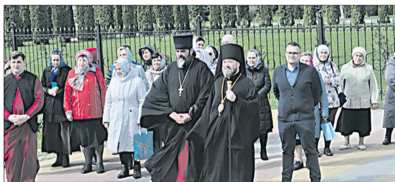
■ Общегородская Пасха за много лет стала поистине важным событием в культурно-духовной жизни города Строителя. / ФОТО: Н. АЛЕКСЕЕВОЙ

- По всей округе раздаётся пасхальный благовест, и наши души радуются особо - мы празднуем Великий праздник. В Светлое Христово Воскресение Господь победил смерть жизнью, зло добром, ненависть любовью. Желаю всем, чтобы пасхальная радость разносилась по домам и весям округа, чтобы все яковлевцы делились ею друг с другом, - сказал владыка