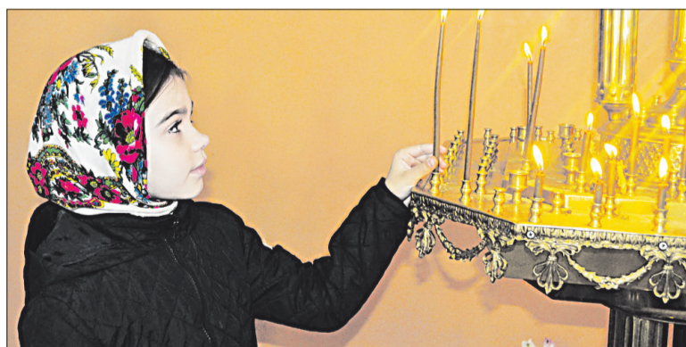
■ В храме Новомучеников и Исповедников Белгородских было в этот день многолюдно, на праздник пришли и стар, и млад.