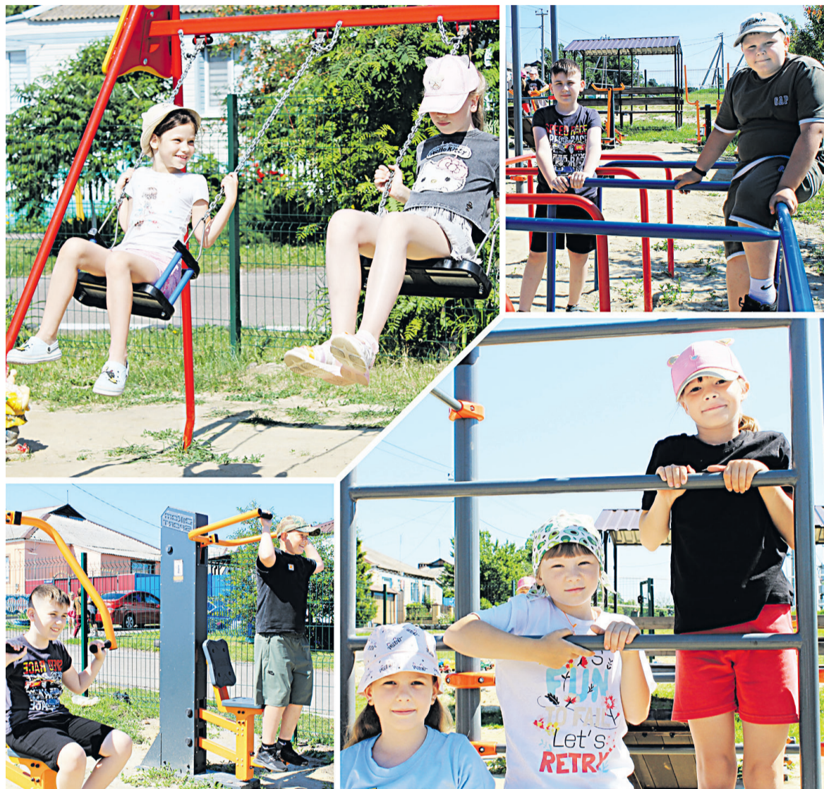
☒ Детвора и подростки села Дмитриевка радостно, весело и с пользой проводят время на новой площадке.

Мужчине, получившему акубаротравму, медики бригады СМП оказали помощь на месте. Он продолжает лечение амбулаторно. На месте атаки загорелся грузовой автомобиль — пожарным расчётом возгорание ликвидировано.