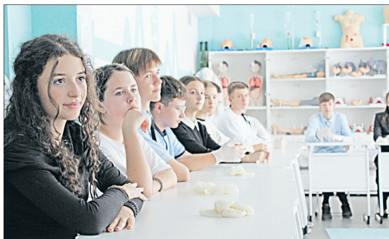
📷 Школьники внимательно слушали специалиста, а также отвечали на вопросы по оказанию первой помощи.

На открытом уроке будущие медики отработали действия по оказанию первой помощи