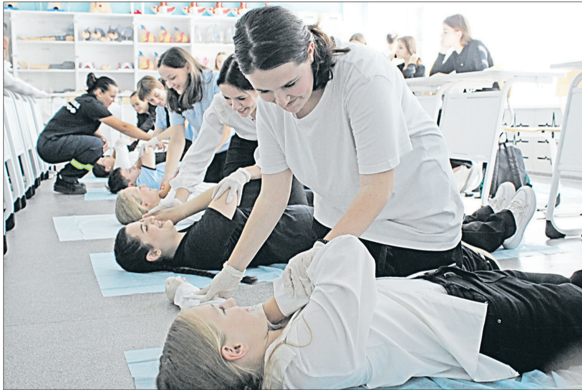
📷 Продемонстрировать и закрепить полученные знания на практике – этот момент оказался для будущих медиков самым интересным на открытом уроке.

Как сообщает пресс-служба администрации округа, новые места для отдыха ребят оборудуют в Томаровке по улице Комсомольской в районе дома № 109 и по улице Данилова в районе дома № 8. В селе Бутово — по улице Речной, дом 7.