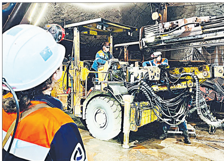
Для ректора НИУ «БелГУ» было интересно своими глазами увидеть, как организован процесс добычи руды.

В ближайшее время участники проекта должны определить опытный участок на территории карьера закладочных песков и подготовить проектную документацию. Далее предстоит посадка фитокомпонента в рамках рекультивации карьера и проведение