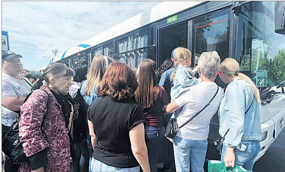
☒ Свои двери собравшейся на остановке толпе открыл только третий автобус.

Стороны обсудили актуальные вопросы безопасности персонала энергокомпании при проведении работ и защиты электросетевых объектов в условиях высокого уровня террористической опасности.