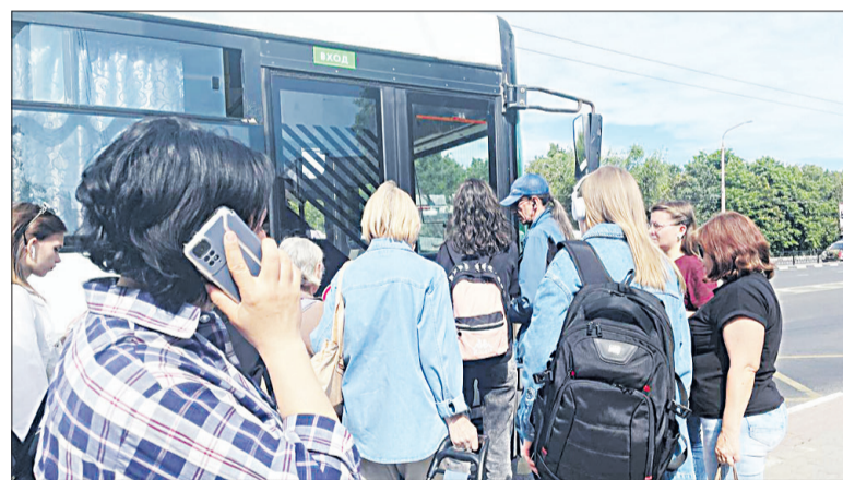
☒ Срочные дела пришлось отложить – на рейсе опять срыв.

Утро рабочего дня. Из столицы региона многие спешат