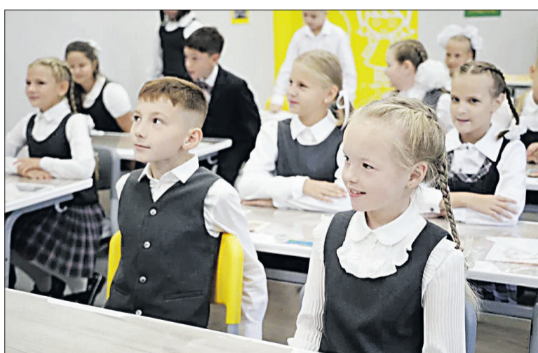
■ Счастливые лица учеников после длительного дистанта.

На открытие 3-й городской после капитального ремонта приехал губернатор Белгородской области Вячеслав Гладков. Он особо контролировал этот сложный объект, который и ремонтировался непросто, да и сейчас не совсем ещё готов. Но, как пообещал глава региона, в ближайшее время доведут до ума часть фасада и школьный стадион. Само же помещение школы полностью готово к приёму ребят и к нормальному образовательному процессу. Задача же учеников, как под-