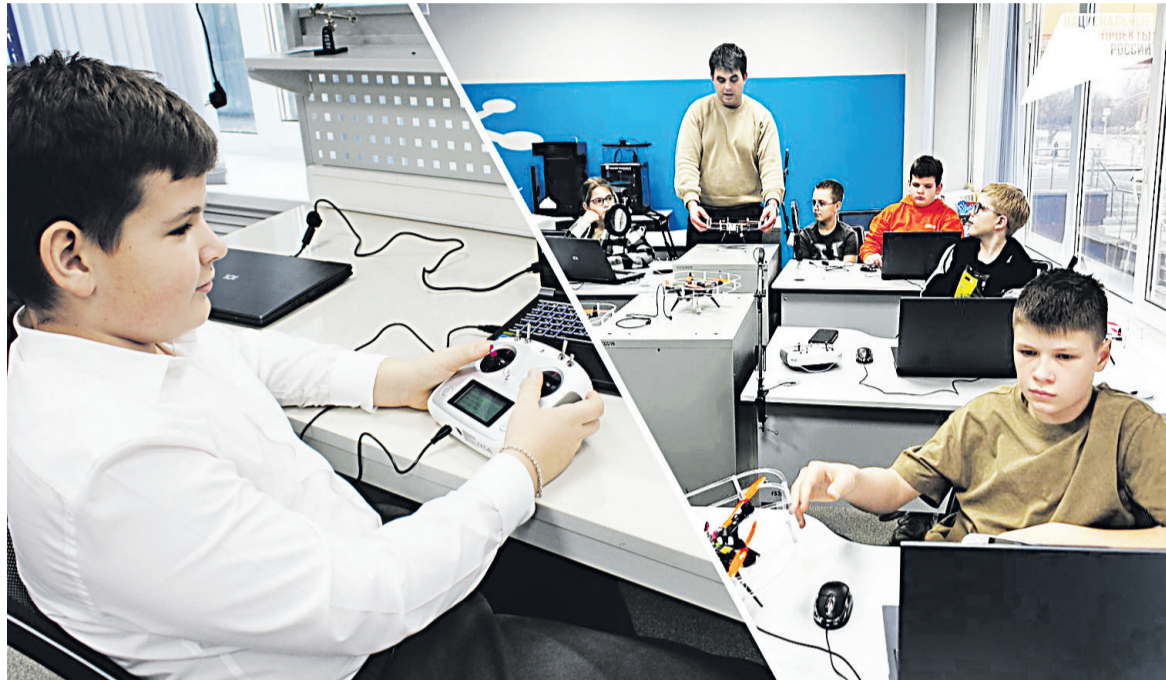
В 2024 году к реализации национального проекта «Беспилотные авиационные системы» подключились образовательные учреждения Яковлевского округа.

При тушении спасатели обнаружили тела девочек 1 года и 3 лет.