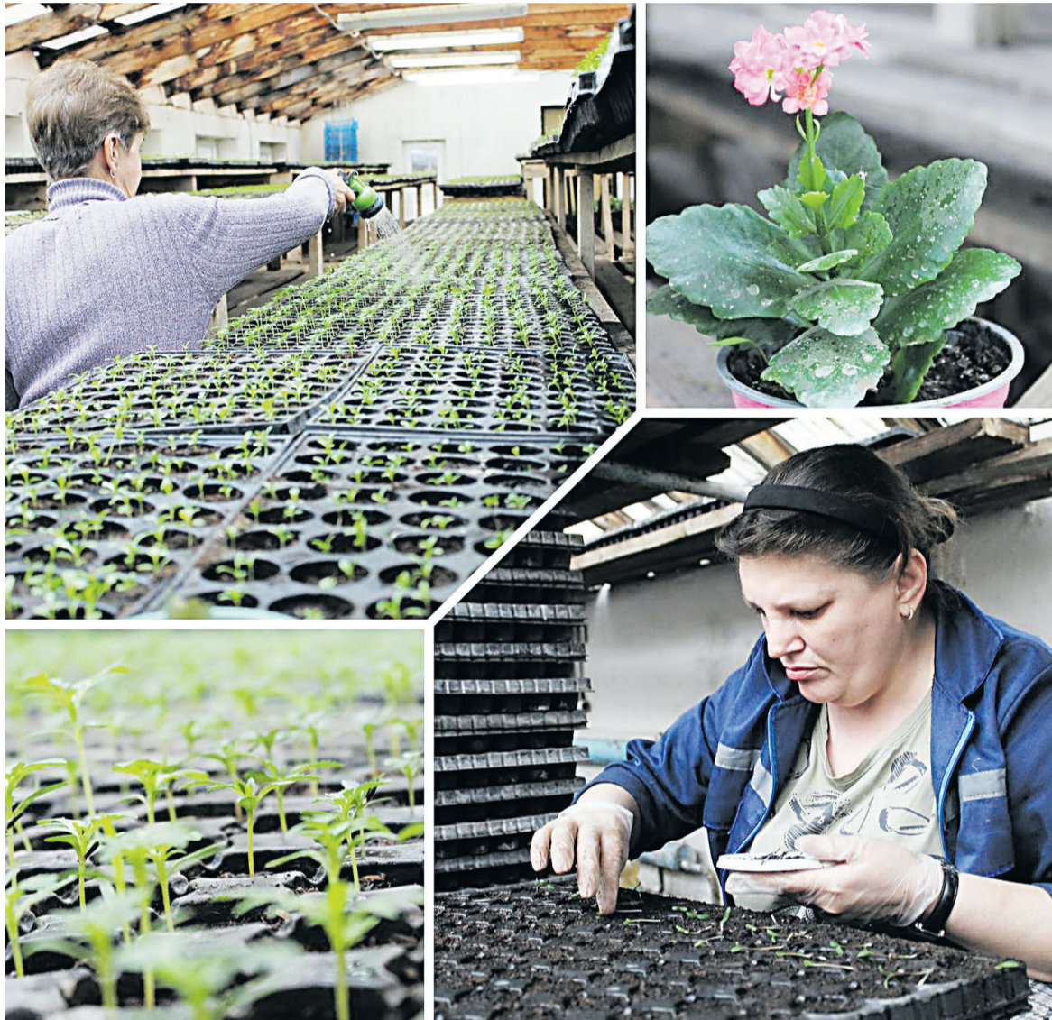
■ Пикировка - это очень тонкая и скрупулёзная работа, которая под силу только профессионалам.

Авария произошла на 25-м километре дороги «Крапивенские Дворы — Сажное — Кривцово — Шляхово». По предварительным данным, за рулём питбайка BSE находился 16-летний подросток, у которого нет водительского удостоверения. При перестроении юный водитель нарушил правила маневрирования и врезался в автомобиль «Лада Гранта» под управлением 57-летнего мужчины. В результате аварии травмы получил несовершеннолетний водитель двухколёсного транспорта. Обстоятельства происшествия устанавливаются.