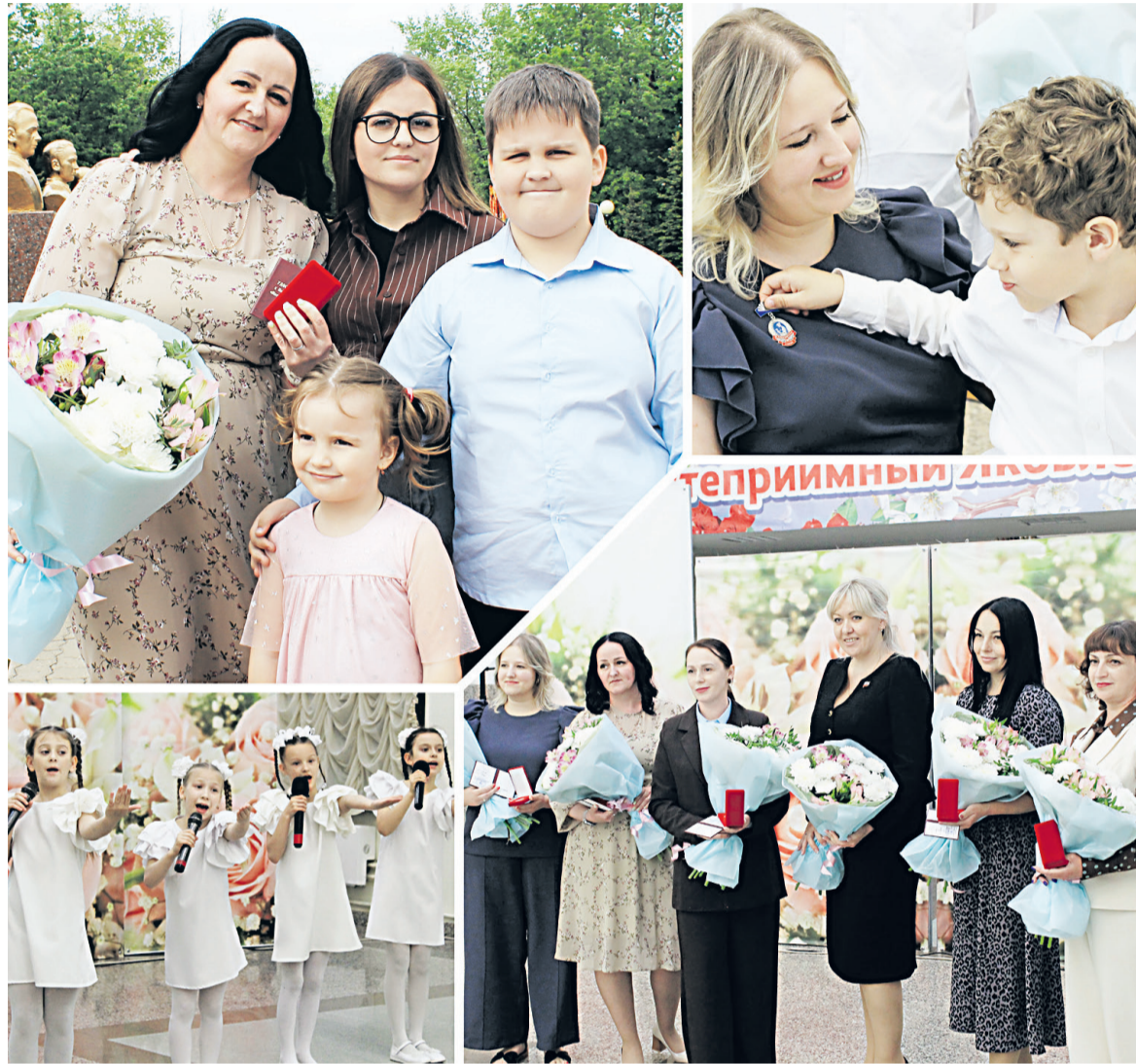
Международный день семьи - яркий, душевный и творческий семейный праздник.

В селе Бутово в результате детонации беспилотника повреждены окна и фасады административного здания. Пострадавших нет.