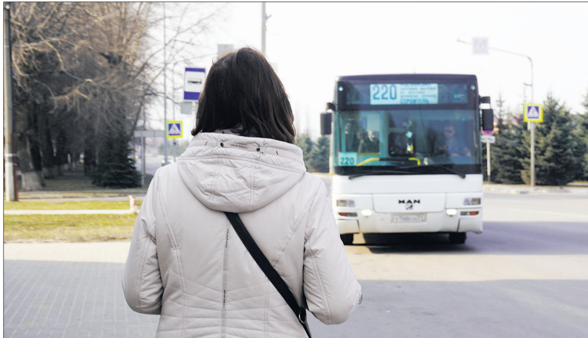
■ Актуальным вопросом для яковлевцев остаётся тема транспорта.

Чтобы поздравить представительниц прекрасной половины человечества, проживающих в Яковлевском доме-интернате для престарелых и инвалидов, волонтеры доставили в учреждение подарки, замечательные открытки от воспитанников Дома детского творчества, ароматную выпечку и угощение.