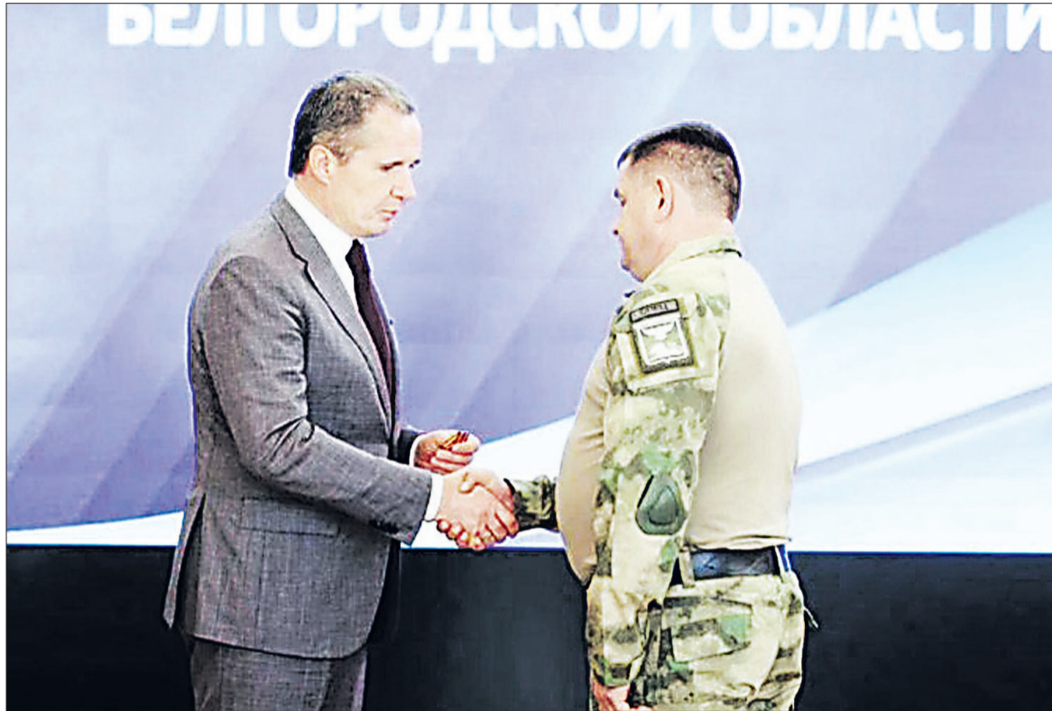
Глава региона регулярно отмечает заслуги бойцов региональной самообороны.

В отношении водителя возбуждено уголовное дело. Ему грозит до трёх лет лишения свободы.