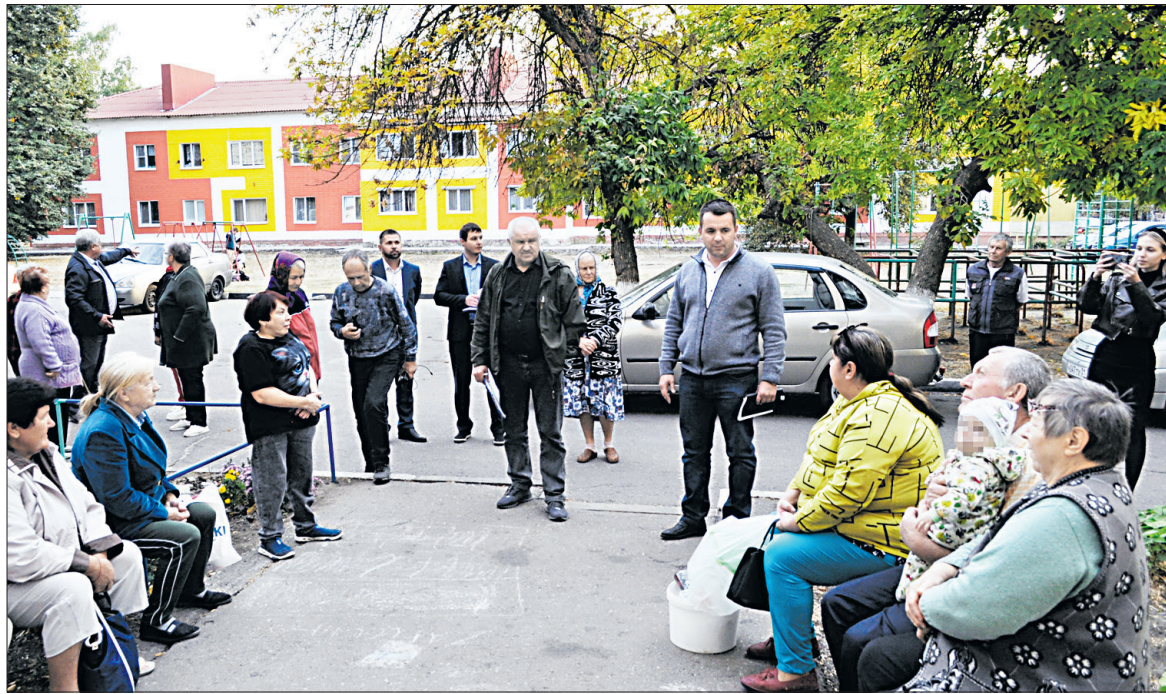
Заместители главы администрации округа и руководители служб выслушали жалобы со стороны жильцов.

По словам специалиста, из-за сложившихся температурных условий и минимального количества осадков за последние четыре месяца на территории Белгородской области возникают ландшафтные пожары, а сильные порывы ветра днём способствуют их значительному распространению. Сейчас в сутки в регионе фиксируется 20-30 очагов возгорания, за сентябрь — более 300.