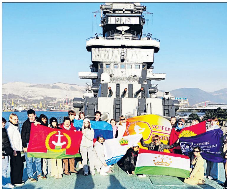
Участники конкурса посетили достопримечательности Новороссийска.

В финальном очном этапе конкурса необходимо было