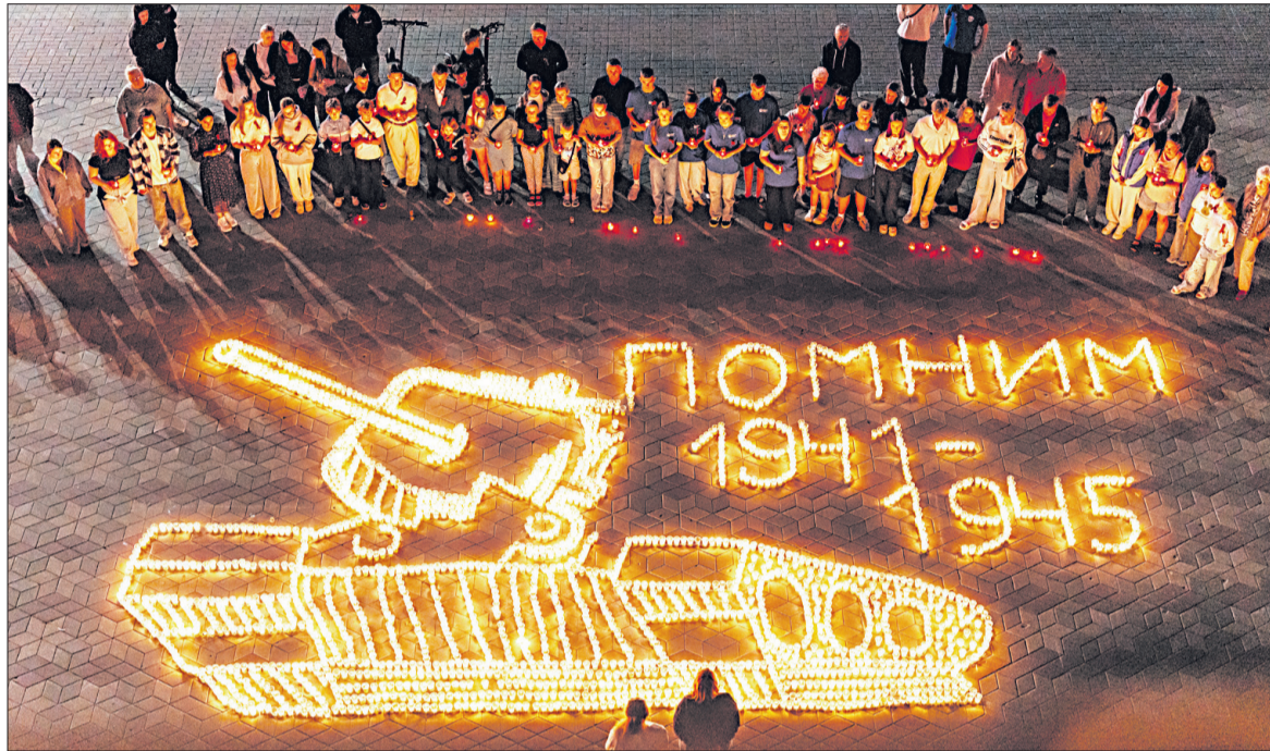
■ Огненная картина из 5,5 тысячи свечей стала главным символом памяти и скорби в Строителе.

В Строителе Яковлевского округа беспилотник ВСУ атаковал многоквартирный дом. В одной квартире в результате детонации загорелся балкон. Пожарным расчётом возгорание было ликвидировано. Также в доме были повреждены фасад и окна. Пострадавших нет.