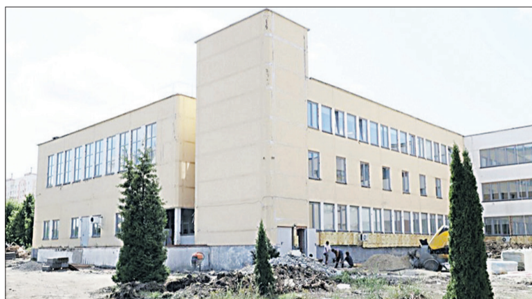
Обновлённое здание и территория третьей понравятся и педагогам, и ученикам.

Новая школа общей площадью более 24 тыс. квадратных метров будет рассчитана на 1100 мест и строится в рамках областной программы «Создание новых мест в общеобразовательных организациях Белгородской обла-