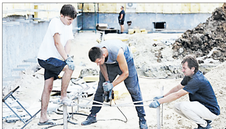
Строители спешат завершить благоустройство территории.

сти» и национального проекта «Образование».