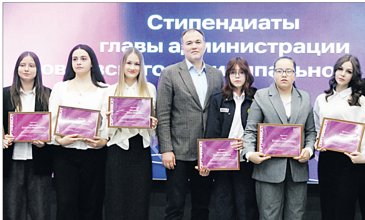
■ Двадцать школьников муниципалитета будут получать стипендию главы Яковлевского округа.

С помощью этих средств более 16 тысяч ребят из приграничья, детей участников СВО и из многодетных семей смогут отдохнуть в детских лагерях и санаториях Краснодарского края, Крыма и в других регионах страны. Информацию о том, как и в каких именно лагерях и санаториях будет организован отдых, доведут через директоров школ и классных руководителей.