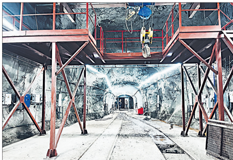
☉ Так выглядит подземное депо.

В рамках открытия нового объекта губернатор области Вячеслав Gladков и первый заместитель губернатора Дмитрий