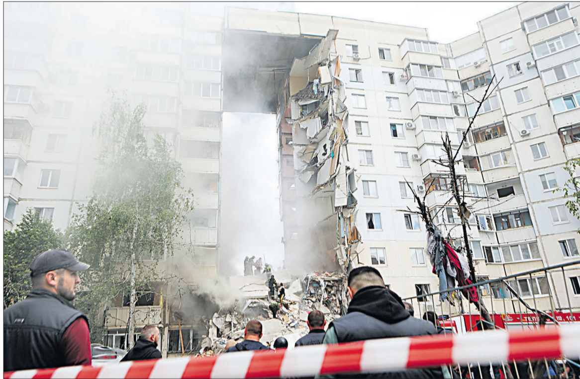
📍 В первые минуты после обрушения подъезда.

Максим является воспитанником клуба карате «НАМИ». Он провёл пять боёв в самой конкурентной категории, на которую заявили 42 человека. Яковлевские спортсмены завоевали и пять медалей на открытом областном турнире по дзюдо в Тамбове. Соревнования прошли среди юношей 2011-2012 годов рождения. В них приняли участие спортсмены из четырёх регионов страны. В их число вошли и воспитанники Спортивной школы олимпийского резерва Яковлевского городского округа. Ребята показали достойную борьбу и добились отличных результатов.