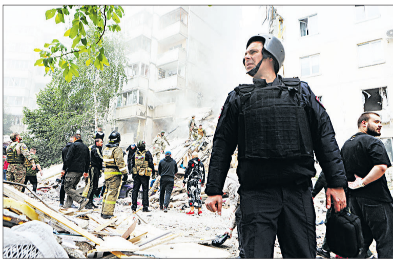
📍 В ликвидации последствий трагедии принимали участие спасатели МЧС, члены теробороны, простые граждане.

На место прибыл губернатор Вячеслав Гладков. Пока работали спасатели, он постоянно общал о ходе разборки завалов. Глава региона подвёл нерадостный итог дня. В результате масштабных обстрелов со стороны вооружённых формирований Украины за этот день в Белгороде погибли 21 мирных жителей (тела 17 извлекли из-под завалов дома, одна скончалась в больнице, трое погибли в результате последнего обстрела), 27 человек получили ранения различной степени тяжести.