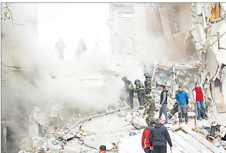
📍 До утра понедельника не прекращался разбор завалов на месте трагедии.