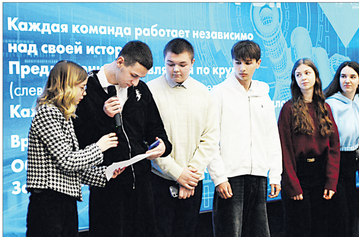
■ В деловой игре яковлевцы представили цепь решений по заданной теме.

Сотрудники ОМВД России «Яковлевский» провели серию лекций для учащихся СОШ № 2 города Строителя, Томаровской № 1 и Смородинской школ. Повод тревожный: кибербуллинг, по словам полицейских, перестал быть редким явлением и превратился в системную угрозу. Инспекторы объяснили, чем травля в Сети опаснее реальной. Кибербуллинг отличается масштабом распространения, анонимностью агрессоров и круглосуточным доступом к жертве через интернет и мобильные устройства.