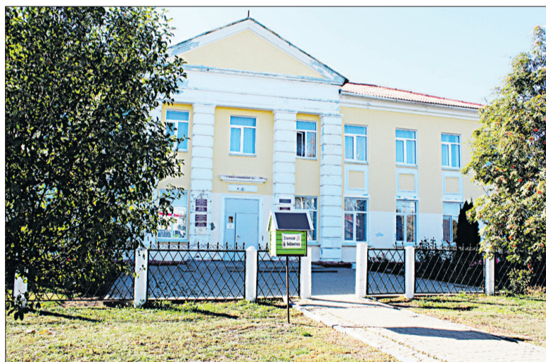
■ Гостищевская библиотека станет центром развития творческих способностей и общения для селян.

В число счастливых вошла Гостищевская сельская библиотека, которая в соответствии с условиями конкурса