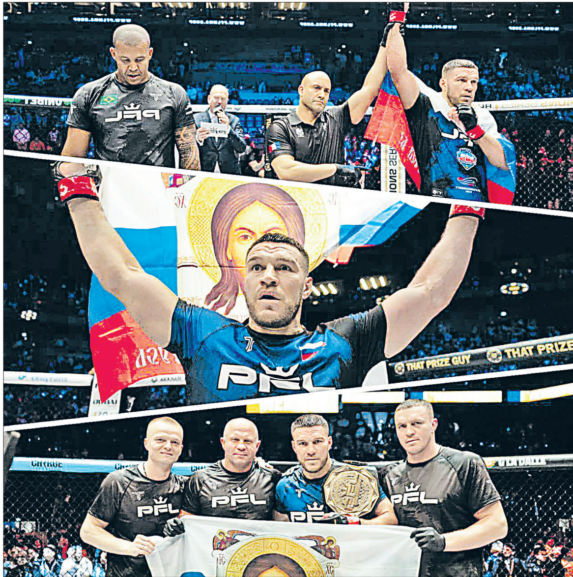
Как и подобает спортсмену, рождённому на яковлевской земле, Вадим Немков показал на ринге стальной характер и стойкость духа.

В Доме культуры села Гостищево прошёл праздник перевоплощений. Местная молодёжь, переодетая в любимых персонажей, участвовала в параде, танцевальных батлах и конкурсах. В ДК на стенах появились сказочные замки и портреты киногероев, а фоном зазвучали известные саундтреки. Вечеринка позволила ребятам на несколько часов почувствовать себя частью большого сказочного мира.