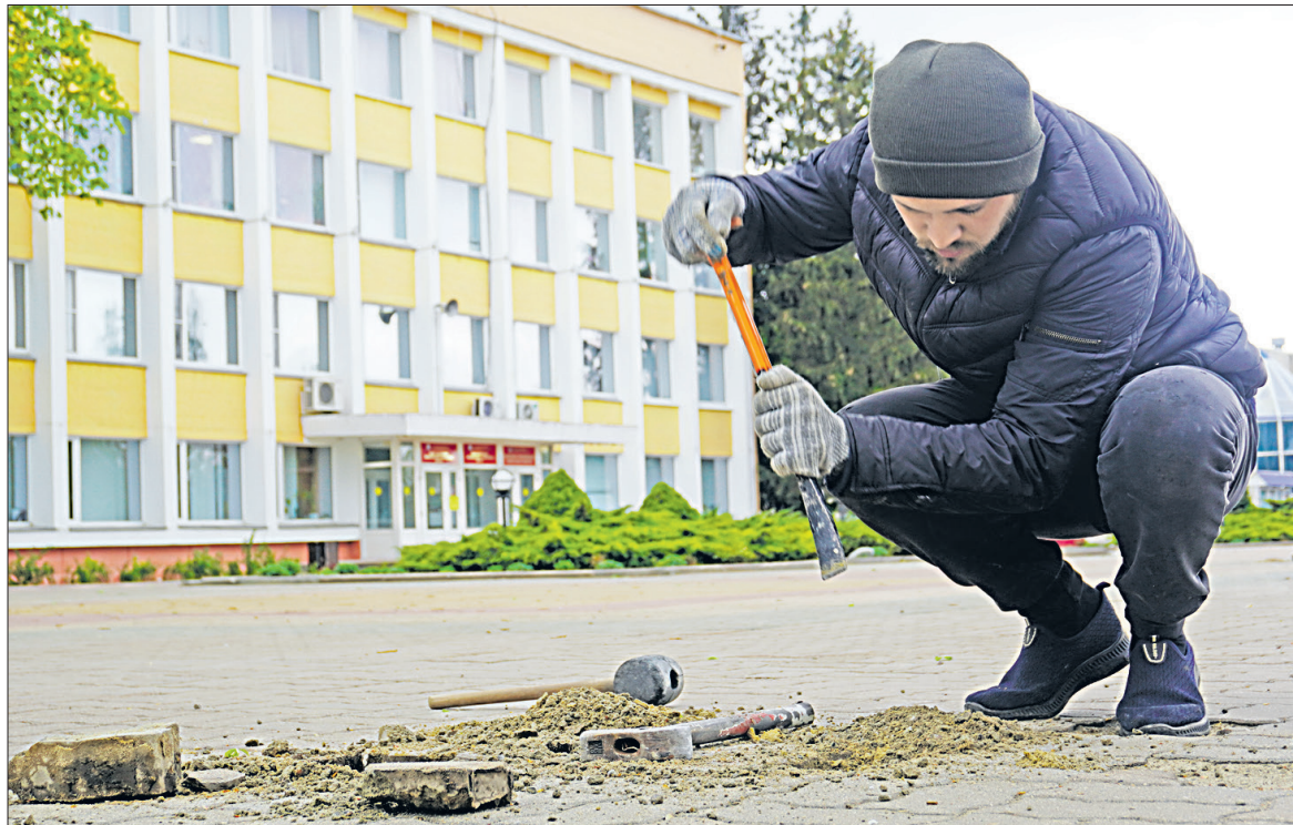
Ремонтники обновят часть повреждённой плитки на центральной площади города.

В упорной борьбе команда СШОР Яковлевского городского округа заняла третье место.