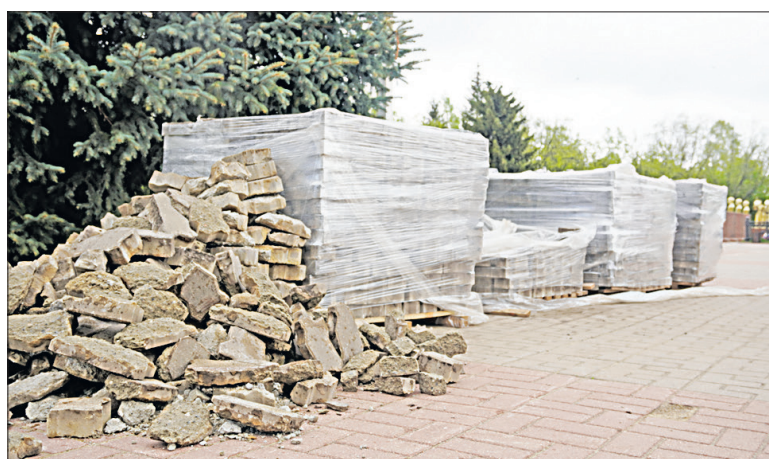
Новое плиточное покрытие заменит старое просевшее полотно.

Повреждённую плитку на центральной площади заменят, и ремонтники уже приступили к работам. Подправят и те места, где плитка просела. Одним словом, специалисты устранят тот неказистый вид, который имело наше «лобное место» в последнее время. И хотя массовые мероприятия пока отменены, будем надеяться, центральная площадь ещё загремит под фанфары и весенних балов, и увидит шествие «Бессмертного полка», и примет массовые народные гулянья.