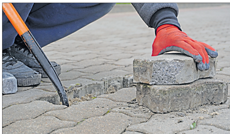
Все внешние дефекты плиточного покрытия площади в скором времени будут устранены. / ФОТО: А. ЮРОВА