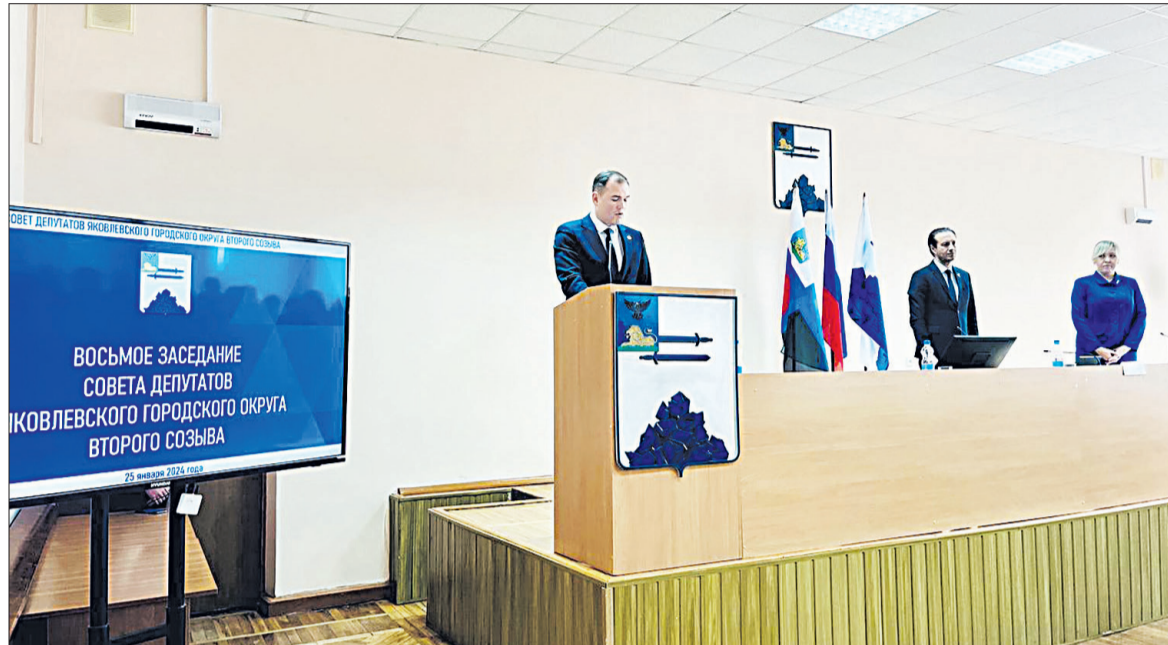
Перед вступлением в должность главы Олег Медведев принял присягу.

В результате ДТП водитель автомобиля «ДЭУ Нексия», а также два пассажира автомобиля «Лада Веста», мужчины 31 года и 36 лет, пострадали и были доставлены в медучреждения.