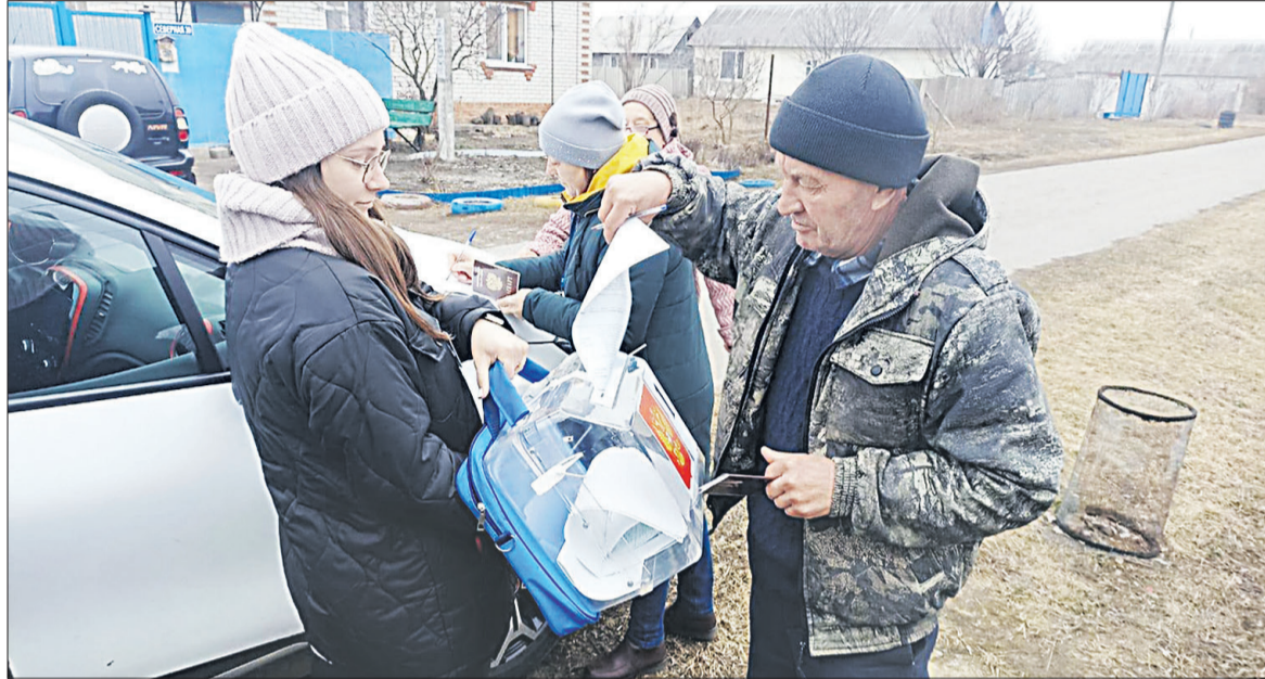
Многие яковлевцы голосовали прямо на «дому».