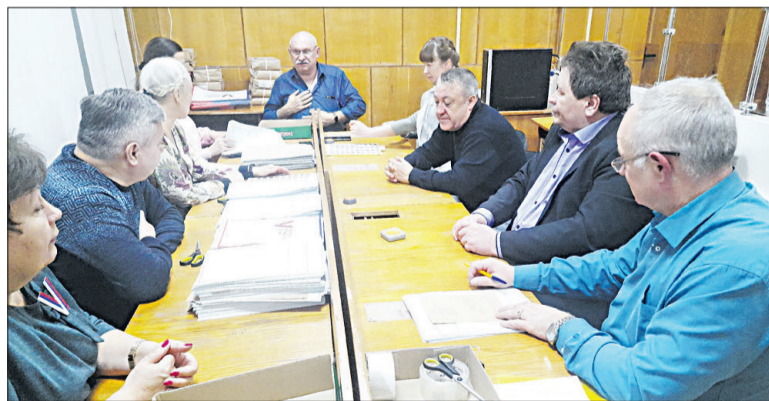
Итоговое ночное заседание территориального избиркома с подписанием протокола.