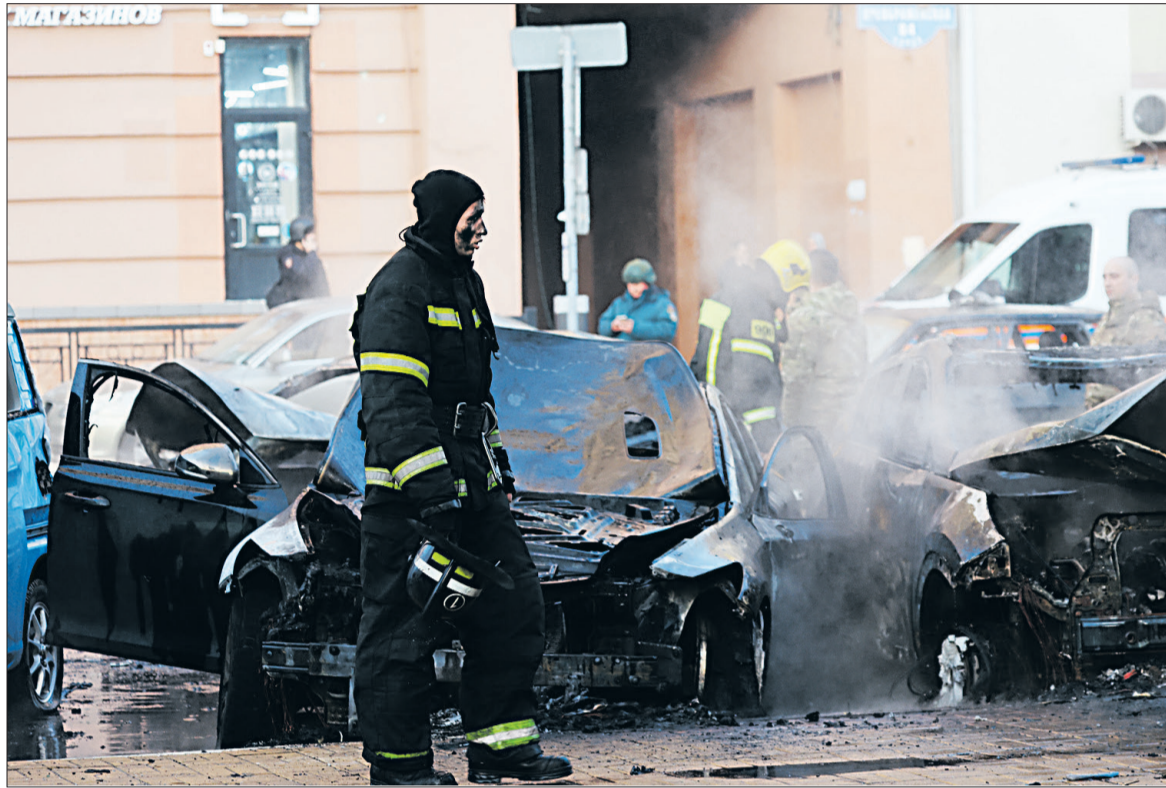
■ Нелёгкая миссия выпала на долю сотрудников МЧС – устранять последствия обстрела.

Среди девушек самой сильной стала команда из Томаровки, на втором месте - из Казацково, на третьем - из Завидовки. Среди юношей первое место забрала также Томаровка. Вторыми стали ребята из Завидовки, а третьими - из Бутово.