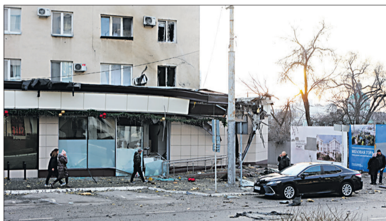
■ Серьёзно пострадал жилой дом с магазином «Кулинария» по проспекту Славы, 47.

Убедительнее эмоциональной риторики могут быть только безумные цифры: 25 погибших, 107 раненых. Различные разрушения в 60 многоквартирных домах, 457 квартирах, 3 частных домовладениях, на 7 социальных и ряде коммерческих объектов, повреждено 166 автомобилей. Таковы последствия масштабной атаки на Белгород со стороны ВСУ днём 30 декабря. Этот скорбный день чёрной меткой войдёт в историю Белгородчины. Региону и так постоянно достаётся с «той» стороны. А такой беспрецедентный обстрел случился вообще впервые. При обстреле центра Белгорода ВСУ применили две ракеты «Ольха» с кассетным снаряжением и снаряды чешской РСЗО Vampire. Обе ракеты и большинство реактивных снарядов сбили, но часть боеприпасов и обломки «Ольхи»