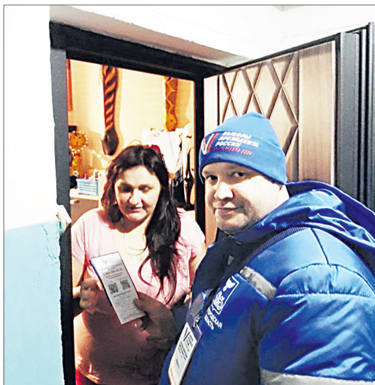
■ Люди открывают обходчикам и внимательно выслушивают, а также задают волнующие их вопросы.

Узнать обходчиков достаточно легко, и перепутать их ни с