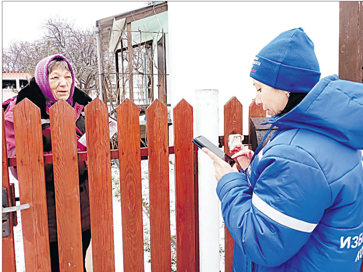
■ Началась работа обходчиков и на Смородинской территории.

Погибшей оказалась собственница жилья 1952 года рождения. Сообщение о возгорании на улице Магистральной поступило в ЕДДС 13 февраля днём. На ликвидацию огня были направлены дежурные караулы двух пожарно-спасательных частей. Другое происшествие: 52-летний водитель сбил идущую по краю проезжей части женщину в Яковлевском городском округе. Авария произошла 17 февраля ранним утром. Водитель на автомобиле «ВАЗ» двигался по улице Новой в селе Драгунском и совершил наезд на 57-летнюю женщину. В результате ДТП пешеход с травмами госпитализирована.